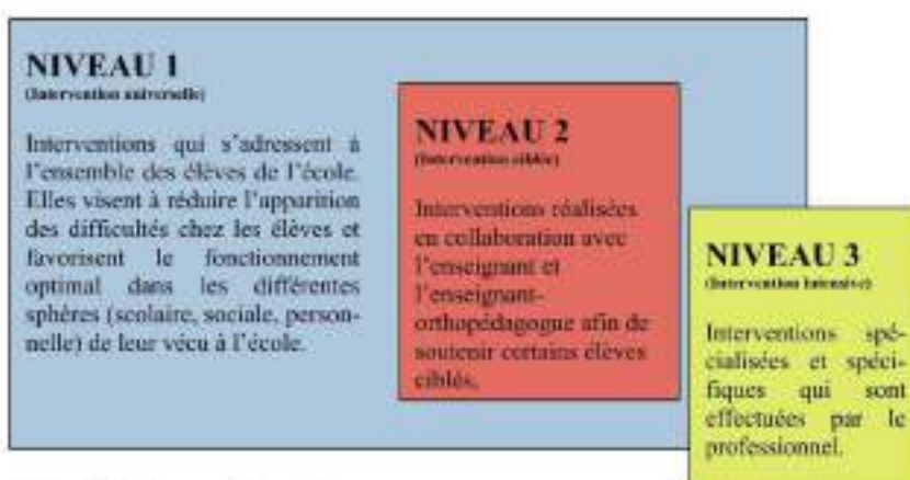
Schéma 1 : Trois niveaux d'intervention

Cette approche propose d'évaluer de façon continue la manière dont l'élève en difficulté répond aux différentes modalités d'intervention graduées qui lui sont proposées.